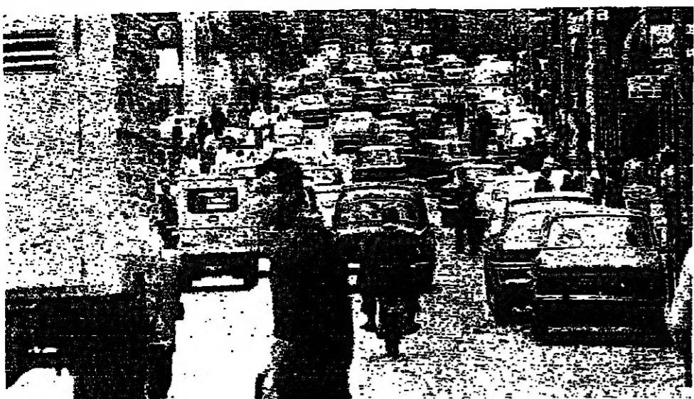
منطقة باب ادریس شهدت ازحاما في حركة السير